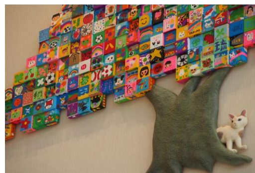
アートワーク「ビックツリー」