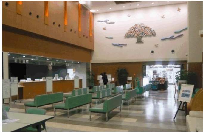
点灯式会場:丸子中央病院 1F エントランスホール

< 世界糖尿病デーとは > 2006年12月20日、国連は国連総会義で、国際糖尿病連合(IDF)が要請してきた「糖尿病の全世界的脅威を認知する決議」を加盟192カ国の全会一致で可決しました。同時に、従来、国際糖尿病連合(IDF)ならびに世界保健機関(WHO)が11月14日を「世界糖尿病デー」として指定しました。国際糖尿病連合(IDF)は決議に先駆け、「Unite for Diabetes」(糖尿病との闘いのため団結せよ)というキャッチフレーズと、国連や空を表す「ブルー」と、団結を表す「輪」を使用したシンボルマークを採用しています。(世界糖尿病デー公式HPより抜粋)