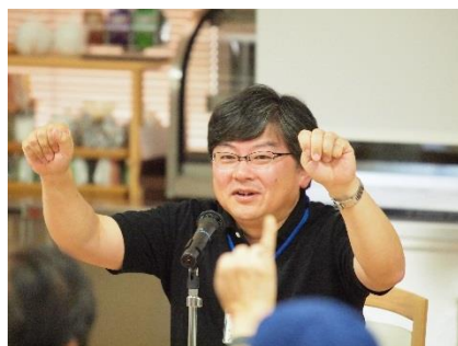
理学療法士による体操コーナー