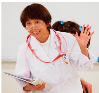
糖尿病センター スタッフによる寸劇